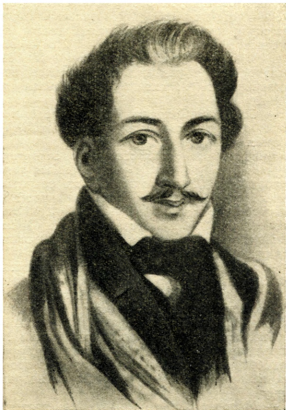
П. Г. Каховский.