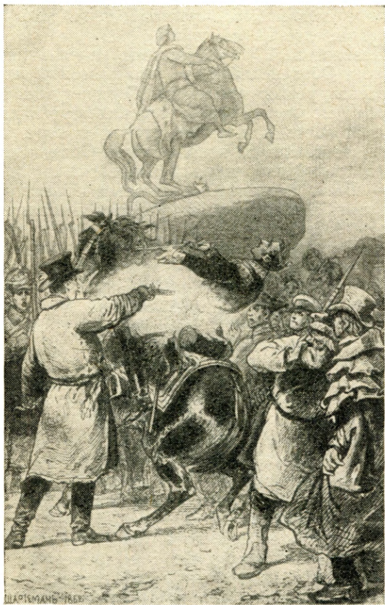
Убийство П. Каховским генерала Милорадовича. С рисунка художника И. Шарлеманя.